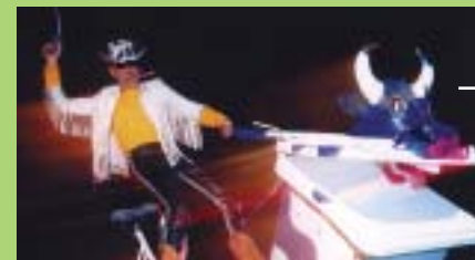
Creatieve vormgeving met PU-schuim en polyesterhars.