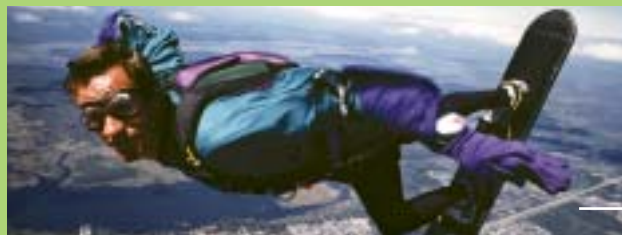
Skysurfboard gemaakt van epoxyhars en koolstofweefsel.

Wat is er allemaal mogelijk met onze producten? Wij tonen u een klein overzicht om u een indruk te geven van de mogelijkheden en verschillende toepassingen van onze producten.