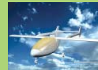
Glasvezelversterkte vliegtuigromp gebouwd door studenten van de TU Delft.